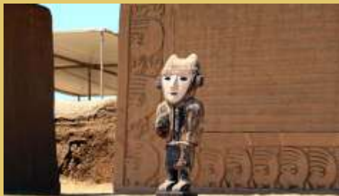
Guardián de Chan Chan