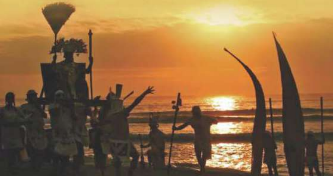
Escenificación de la Llegada de Naylamp