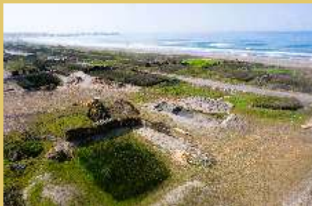
■ Inicio de los trabajos del Proyecto Restauración de los Totorales 2024