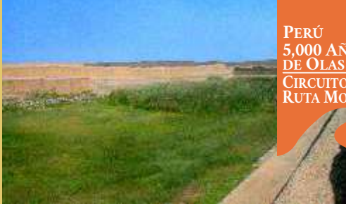
■ Wachaque o chacra hundida en el palacio Nik An, ubicado e Chan Chan, capital del Imperio Chimú.

conocer al mundo las virtudes del caballito de totora y la pesca milenaria sostenible no solo de Huanchaco, sino también de Santa Rosa, Eten, Santa Rosa, Eten, San José, Puemape y otras playas, bajo esa visión el 2016 la Reserva Mundial de Surf de Huanchaco junto con el caballito de totora participó en el Tour de las Reservas Mundiales de Surf de Australia y Perú, tour del cual nos ocuparemos en un próximo artículo, en ese tour el caballito se paseó por más de una docena de playas australianas.