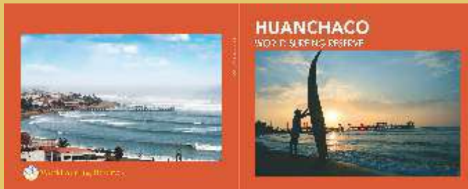
Portada y contraportada del folleto de la Reserva Mundial de Surf de Huanchaco