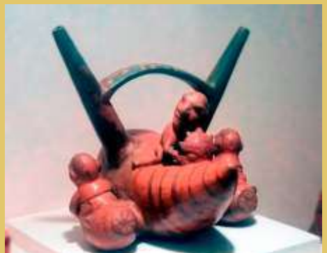
■ Ceramio Chancay con pescador llevando el Spondylus