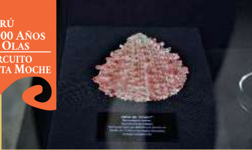
■ Spondylus, Museo de la Cultura Äspero