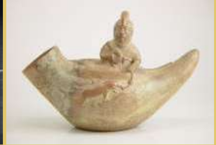
■ Cazador de tiburón, ceramio Moche

más de 1200Km, empezando por el sur por los Nazcas, en el área de Lima fue utilizado por los pescadores de la Cultura Lima, su uso extensivo en esta área abarcó desde Chorrillos, pasando por Barranco, Magdalena hasta llegar al mismo Callao. En el llamado Norte Chico lo hicieron los Chancay, en la región del Santa y al sur de La Libertad, lo hicieron los pescadores de la Cultura Virú (Cultura Gallinazo), en el área de Trujillo lo hicieron los Moches y Chimús, siendo Huanchaco el lugar, donde las evidencias arqueológicas señalan, nació el caballito de totora, lo mismo lo hicieron los naturales de Chicama y los pescadores de lo que ahora es Puemape, Pacasmayo y Chérrepe y al norte de esta región, el caballito aún es utilizado por los pescadores de Eten, Santa Rosa, Pimentel