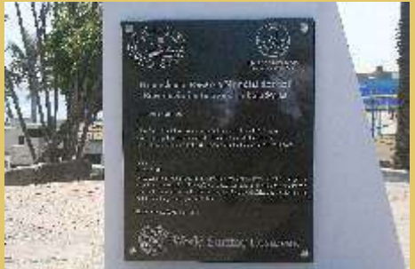
Placa de reconocimiento a los embajadores de la Reserva Mundial de Surf de Huanchaco.