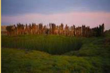
■ Totorales o balsares de Huanchaco.