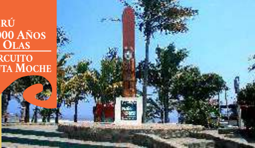
Guardián de la ola de Huanchaco