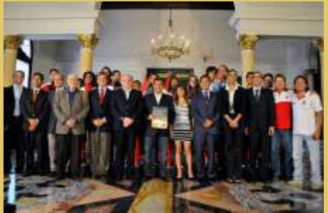
En el Palacio de Gobierno, directivos de la FENTA y consagrados surfistas con el Sr. Presidente de la República Ollanta Humala, celebrando la aprobación del reglamento de la ley 27280