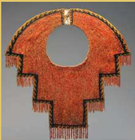
■ Pectoral hecho de Spondylus, Chimu

Huanchaco tiene una cultura viva de más de 3500 años y parte de la visión de los miembros de la RMS de Huanchaco es la de proteger esta cultura viva y dar a