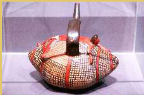
■ Caballito de totora, ceramio Nazca

La totora del quechua “Tutura” es un junco que crece en los humedales de la costa peruana, este junco ( Scirpus californicus ) es la principal materia prima para la construcción de los caballitos de totora. Al norte de Huanchaco se encuentra un área protegida de 2Km de largo por casi 300mt de ancho en su parte más extensa, en esta área los pescadores milenarios de Huanchaco siembran la totora desde hace casi cien años, antes lo hacían en la zona de Chan Chan, capital del Imperio Chimú. Debido a la erosión costera muchas de las pozas donde siembran la totora se han echado a perder y la RMS de Huanchaco con el apoyo financiero de Save the Waves Coalition acaba de ejecutar el Proyecto de Restauración de los Totorales 2024, donde se han construido, limpiado, ampliado y rehabilitado veintiocho pozas, beneficiando a más de dos docenas de pescadores milenarios huanchaqueros. Abajo le mostramos una serie de fotos de la labor de la RMS de Huanchaco trabajando en el área protegida de los totorales.