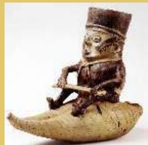
■ Pescador Mocheco sentado en caballito de totora